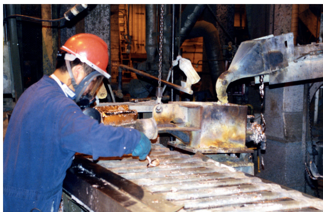
Recyclage des batteries

40 % NON VALORISÉS : MANGANÈSE, GRAPHITE, PLASTIQUES, PAPIERS ET RÉSIDUS